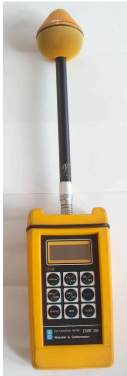
Fig. 1. Il misuratore portatile di campi elettrici e magnetici EMR 300